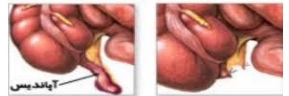
قبل از عمل